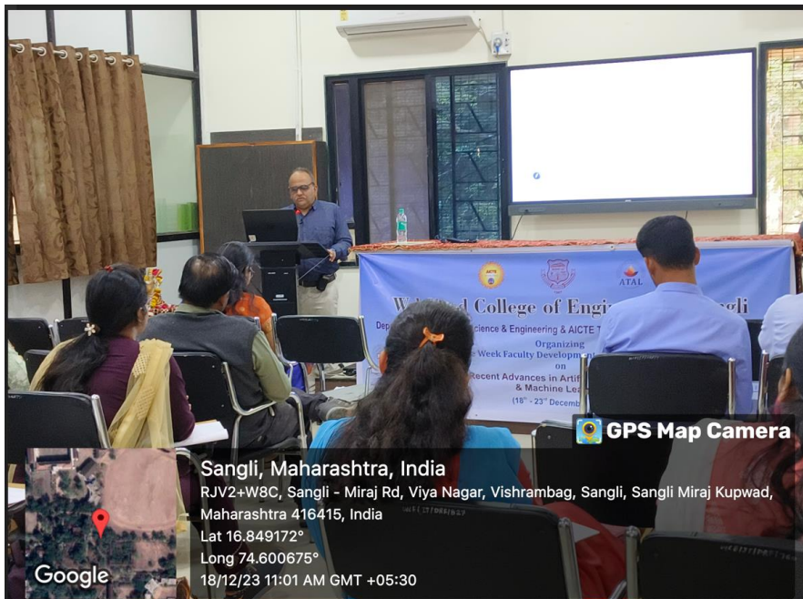
FDP on “Recent Advancement in Artificial Intelligence and Machine Learning” Organized by Computer science & Engg WCE Sangli ,AICTE Sponsored.